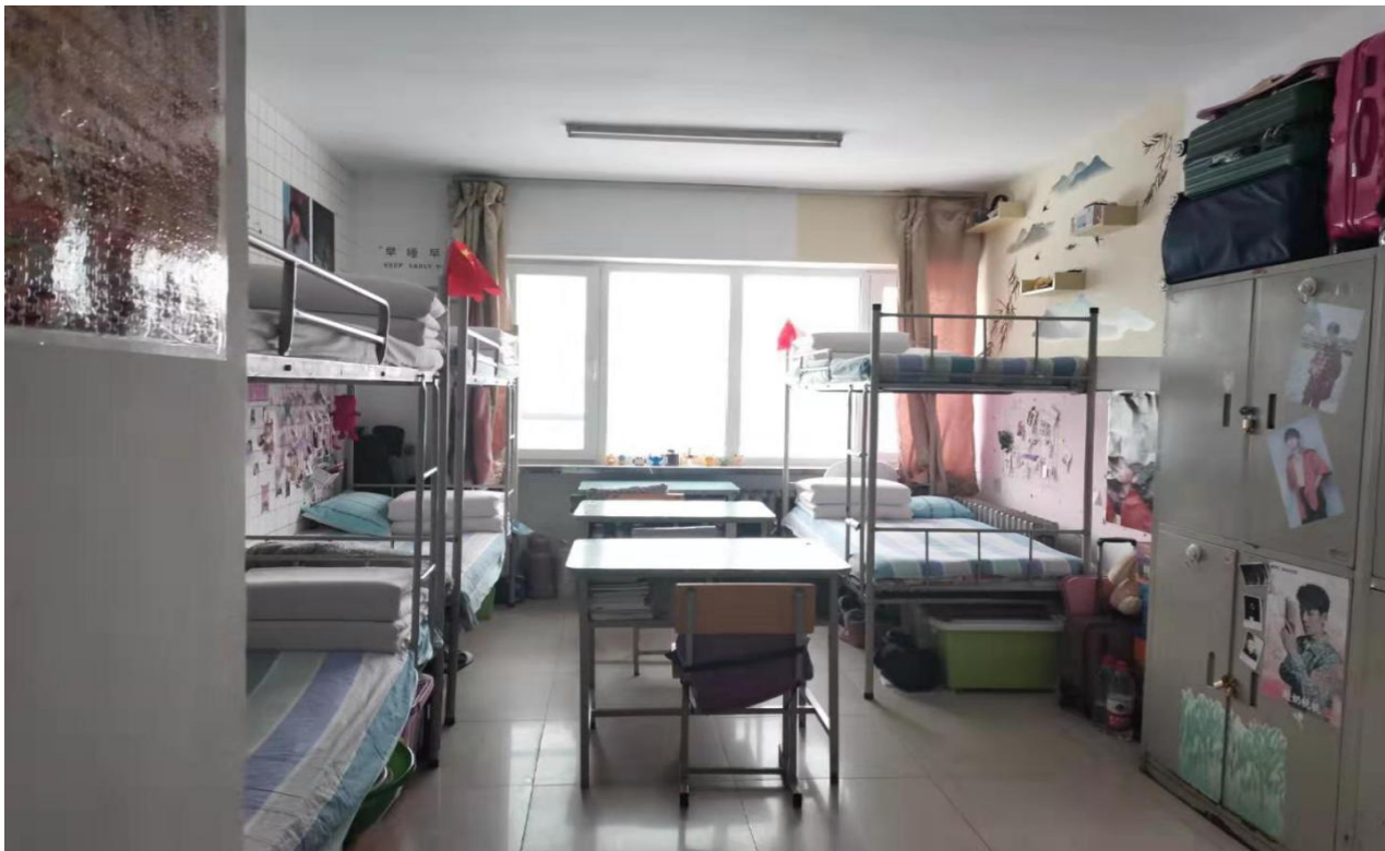
文明寝室-第十四学生公寓 224