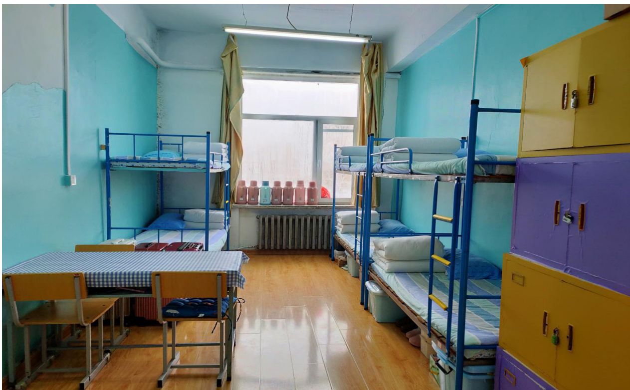
文明寝室-第一学生公寓 331