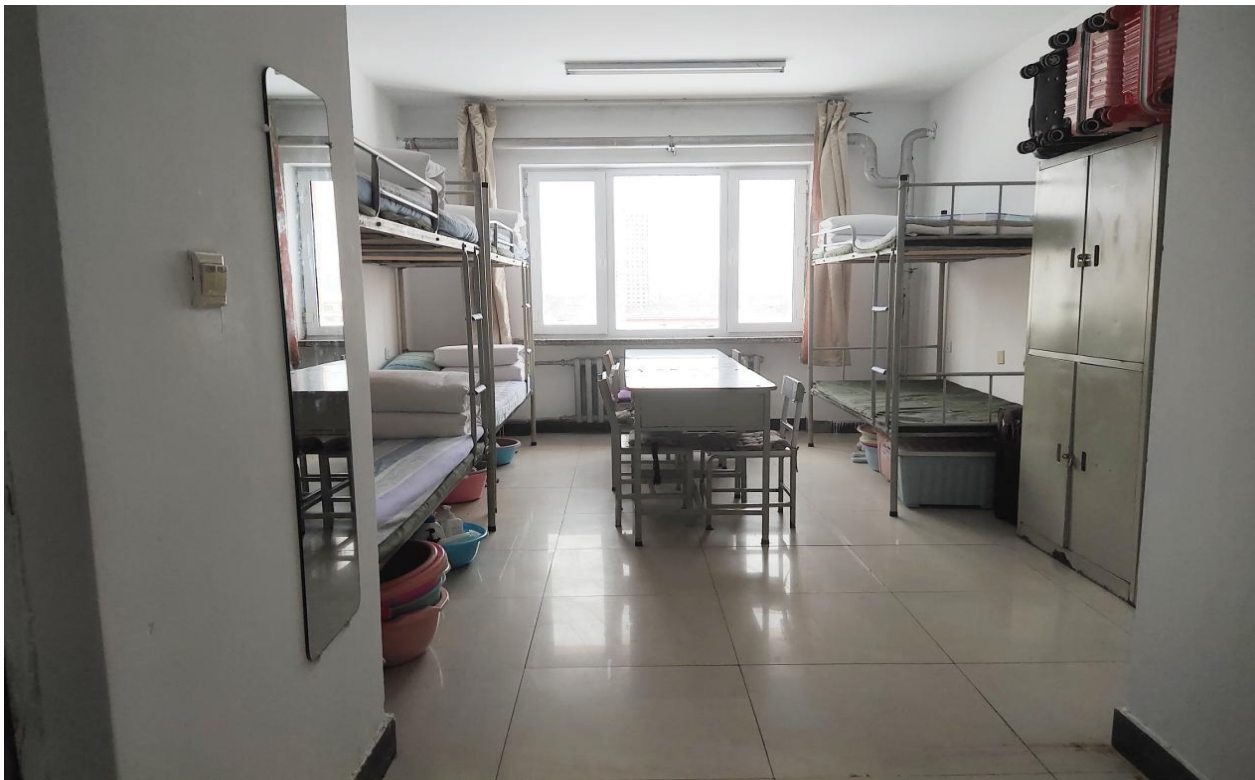
文明寝室-第十四学生公寓 713