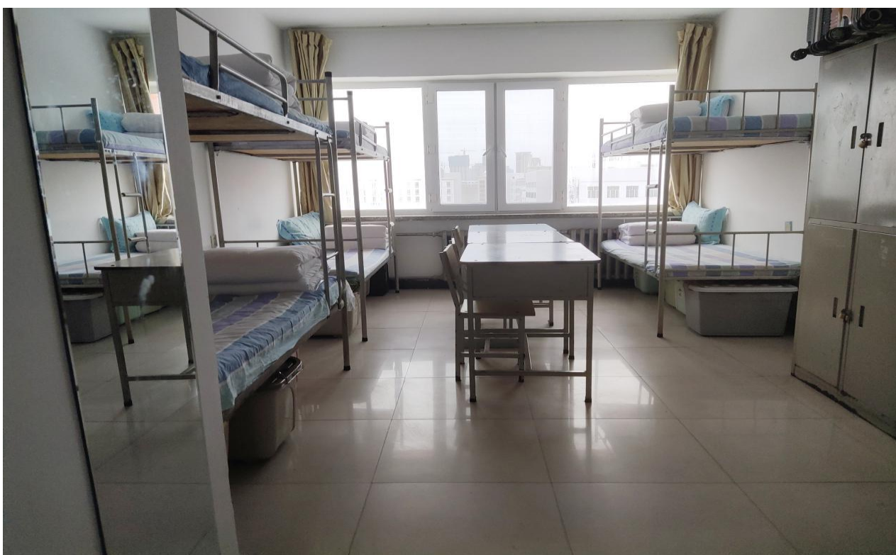
文明寝室-第十四学生公寓 626