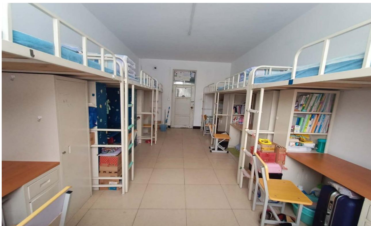
文明寝室-第六学生公寓 241