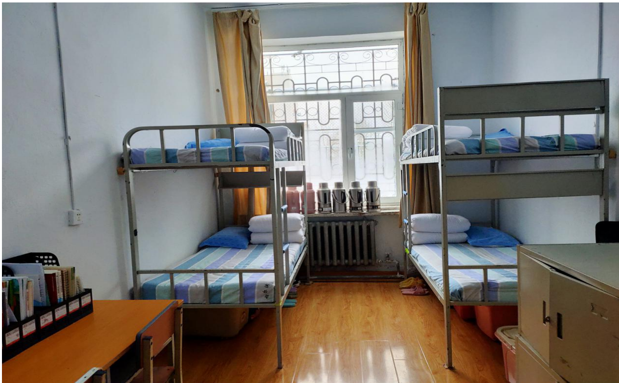
文明寝室-第一学生公寓 126