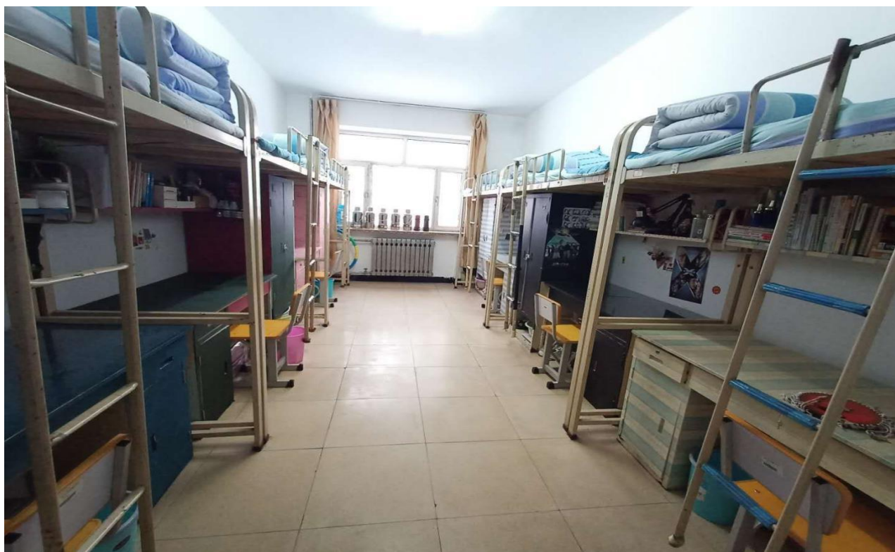
文明寝室-第六学生公寓 129